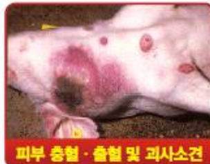
피부 충혈·출혈 및 괴사소견