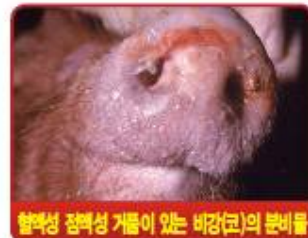
혈액성 점액성 거품이 있는 비강(코)의 분비물

출처 : www.cfsph.iastate.edu , Center for Food Security and Public Health, Iowa State University, College of Veterinary medicine 본 원고에 게재된 사진은 원저자의 허락을 얻고 게재하는 것이므로 사전동의 없이 사진을 무단 사용 할 수 없습니다.