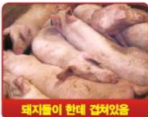
돼지들이 한데 겹쳐있음