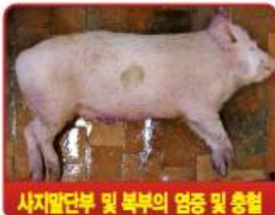
사지말단부 및 복부의 염증 및 출혈